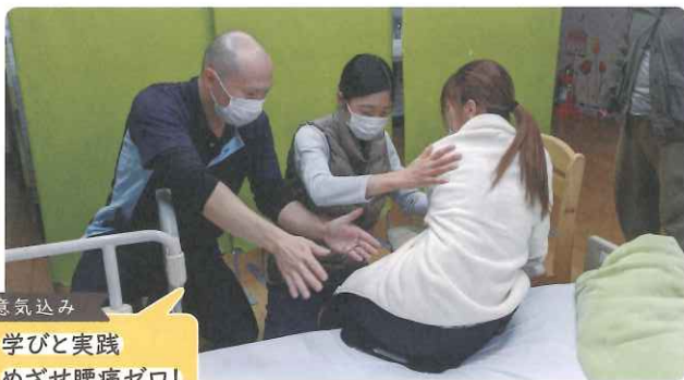
意気込み 学びと実践 めざせ腰痛ゼロ!