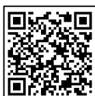
奨励賞受賞者紹介ページ QRコード