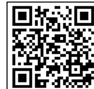
申込フォーム QRコード