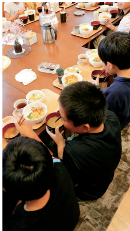
▲子ども食堂「Liaison (リエゾン)」でご飯を頼る子どもたち

に通えるよう、学校や福祉機関との連携がスムーズに行われるようになると思います。そのためには「子ども食堂」の機能や意義を広く知っていただき、信頼してもらえる場所となっていくことが必要で、スクールソーシャルワーカーとし