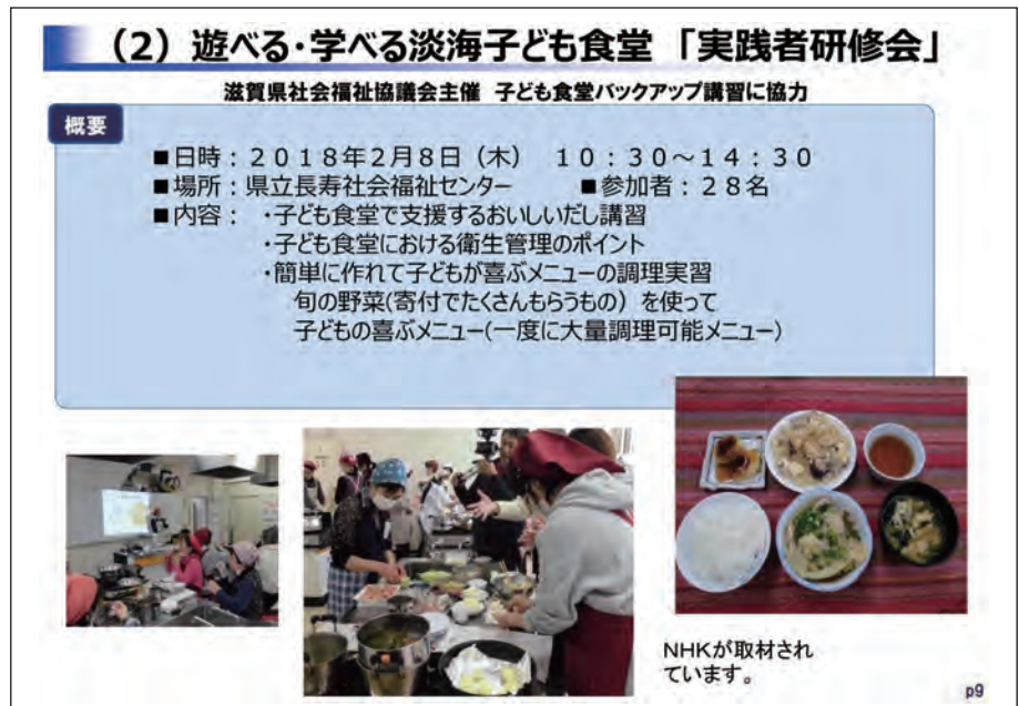
▲大阪ガスのプログラムを生かした子ども食堂実践者研修

さみ煮」、だしをきかせた「もやしとワカメのかき玉汁」、そしておやつに「チーズ in いも餅」を提案させていただきました。手間や栄養、食材にこだわったこれらのメニュー、子ども食堂実践者の皆様のお役に立つことができましたでしょうか。子ども食堂はご飯を通じた地域の居場所として、人と人が繋がる場所です。企業としても「食育」や「子どもの健康づくり」の視点から協力し続けたいと思っています。