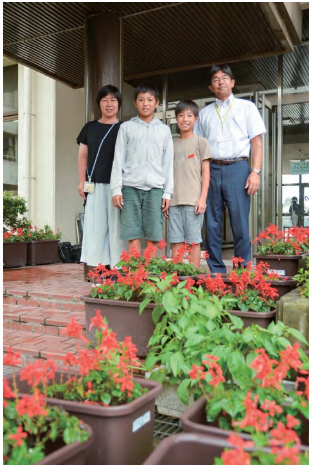
▲高島市立安曇小学校では、リサイクルプランターを使って季節に応じた花を育てています