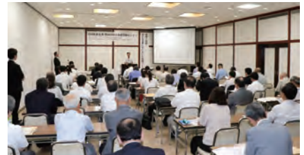
▲企業・団体の社会貢献活動や子ども食堂に関心を持つ約70人が参加

クトの主な事業である「子ども食堂」をテーマに、その実践と企業の支援内容について報告がなされました。今回は、セミナーの内容をまとめてご紹介します。