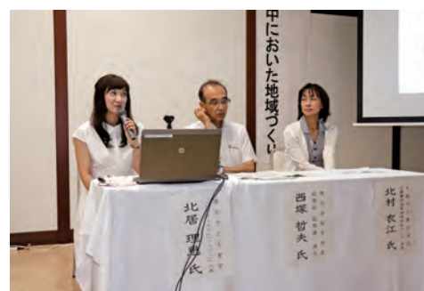
▲北居さんによる子ども食堂の実践報告