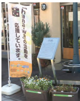
▲大阪ガス株式会社