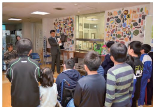
▲滋賀県立長浜養護学校

11月1日には長浜市立神照小学校と滋賀県立長浜養護学校で贈呈式を開催。栽培キットと共にP ネットからのメッセージを届けました。