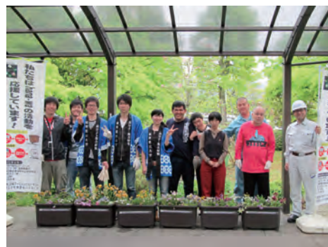
▲旭化成住工株式会社