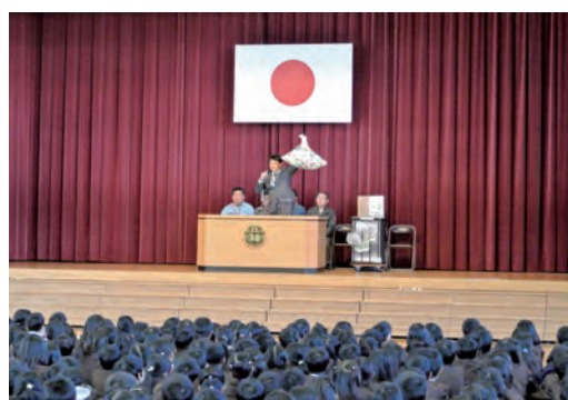
▲長浜市立神照小学校

児童らにキャップリサイクルの見える化と、作業所で働く障害者のキャップ回収・分別などリサイクル活動への関わりを知ってもらうことによる、環境学習・福祉学習に貢献する取組みです。