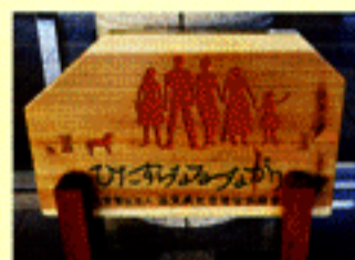
滋賀県社会福祉協議会の正面玄関には、近江学園の園児たちが作ってくれた「ひたすらなるつながり」のレリーフが飾られています