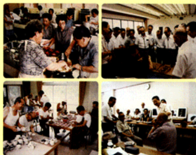
◀初期の頃の授業風景