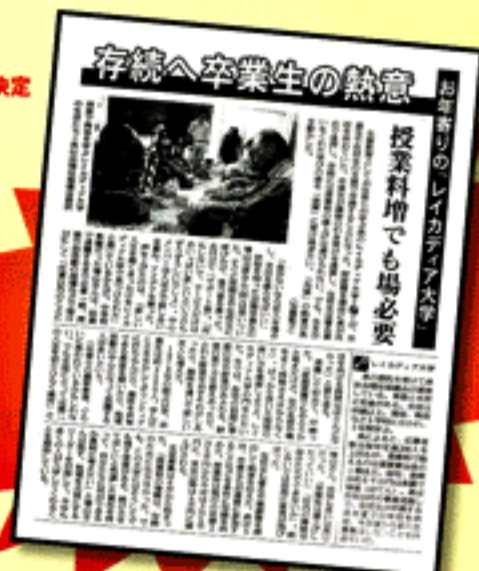
平成22年6月9日→朝日新聞掲載