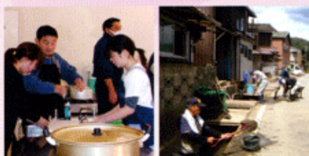
▲災害時炊き出し訓練

「県災害ボランティア活動連絡会」に参画し、平常時から連携ネットワーク化を進めています。その他にも、災害ボランティアの活動支援のための様々な取り組みを進めています。