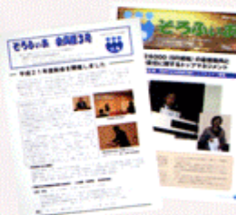
機関紙(左)と情報誌(右)