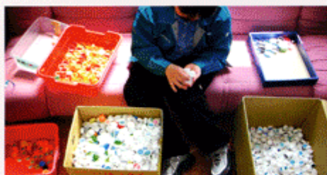
ペットボトルキャップリサイクルの流れ